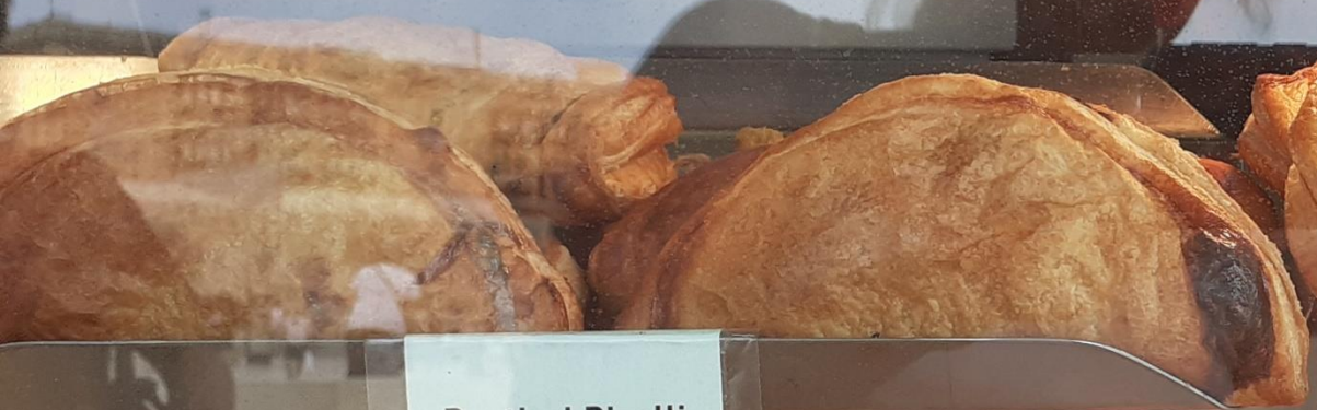
Pastizzi Pizelli Tax Xema (Peas) €0.50