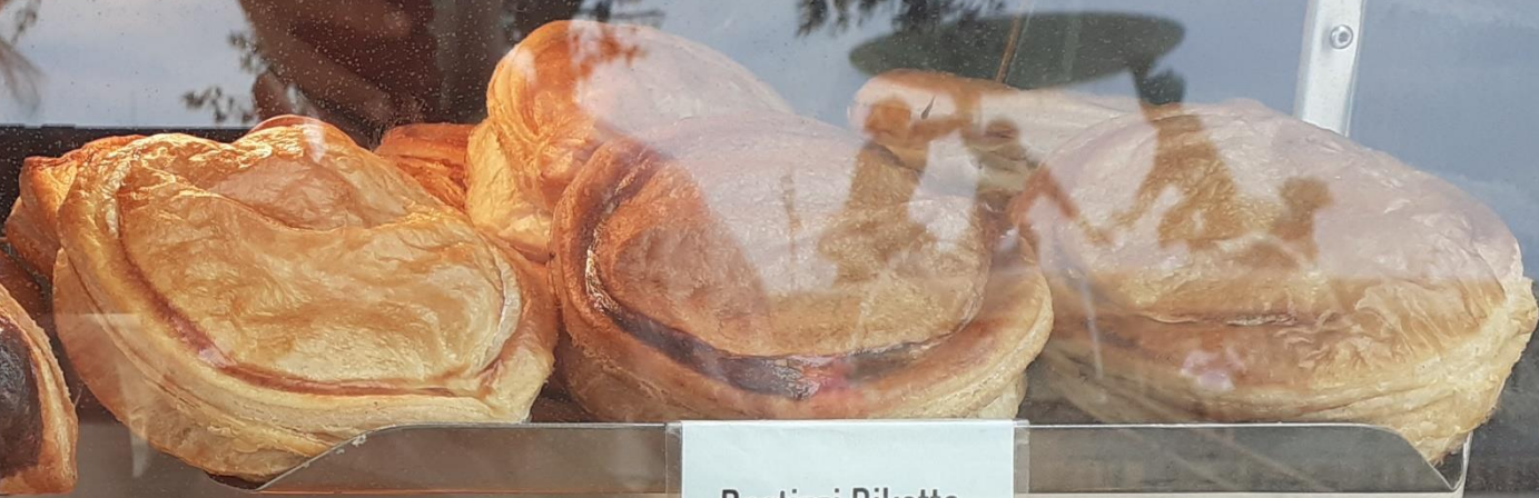
Pastizzi Rikotta Tax Xema (Cheese) €0.50