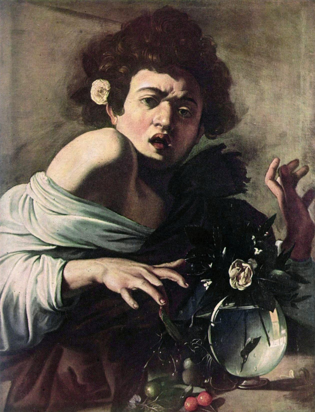
„Chłopiec ugryziony przez jaszczurkę”